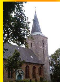
St. Petri Wilstedt