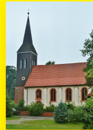
St. Lambertus Kirchtimke