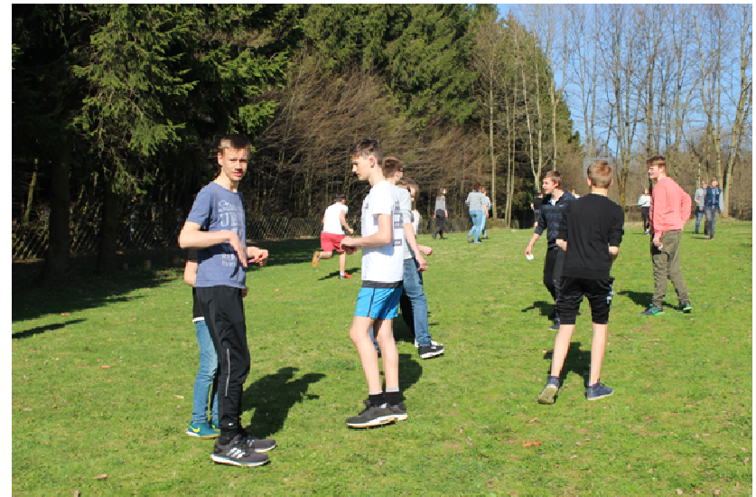
Konfirmanden-Abschlussfreizeit 2017 in Hohegeiß/Harz

Der Konfirmandenunterricht findet etwa 1x monatlich statt und dauert 2 Stunden. Der monatliche Unterricht wird zum Teil ersetzt durch Projekttag und Aktionen. Zum Unterricht gehören auch eine Einstiegs- und eine Abschlussfreizeit.