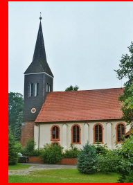
St. Lambertus Kirchtimke