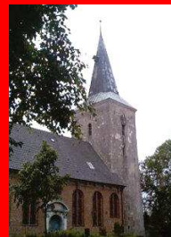
St. Petri Wilstedt