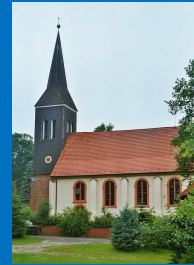
St. Lambertus Kirchtimke