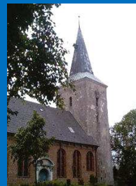
St. Petri Wilstedt