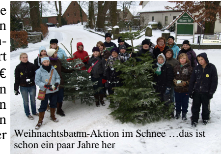
Weihnachtsbaum-Aktion im Schnee ...das ist schon ein paar Jahre her