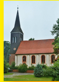
St. Lambertus Kirchtimke