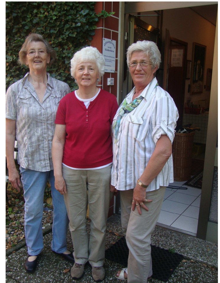
Die guten Seelen der Kleiderbörse