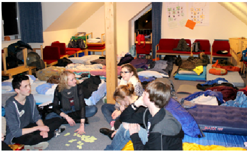
Kennlernprogramm zwischen Schlafsäcken