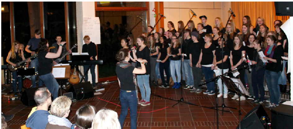
TEN SING Tarmstedt in Kooperation mit dem CVJM- Landesverband Hannover