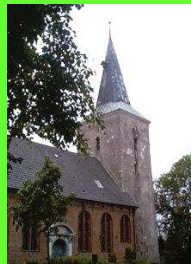
St. Petri Wilstedt