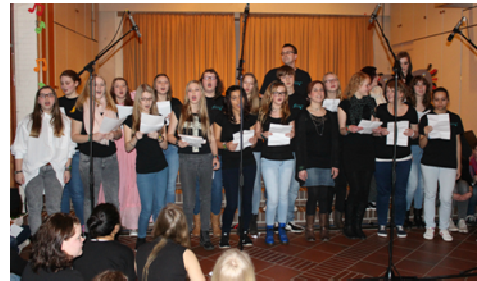
TEN SING Chor Ostrhauderfehn