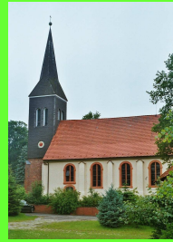
St. Lambertus Kirchtimke