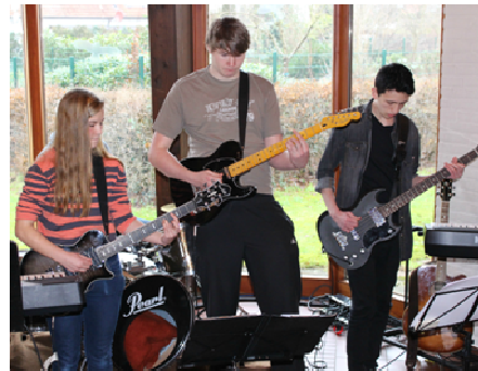
Bandprobe in der Kirche