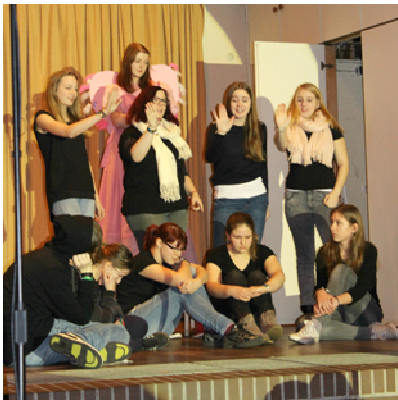
Theaterprobe mit Kostümen